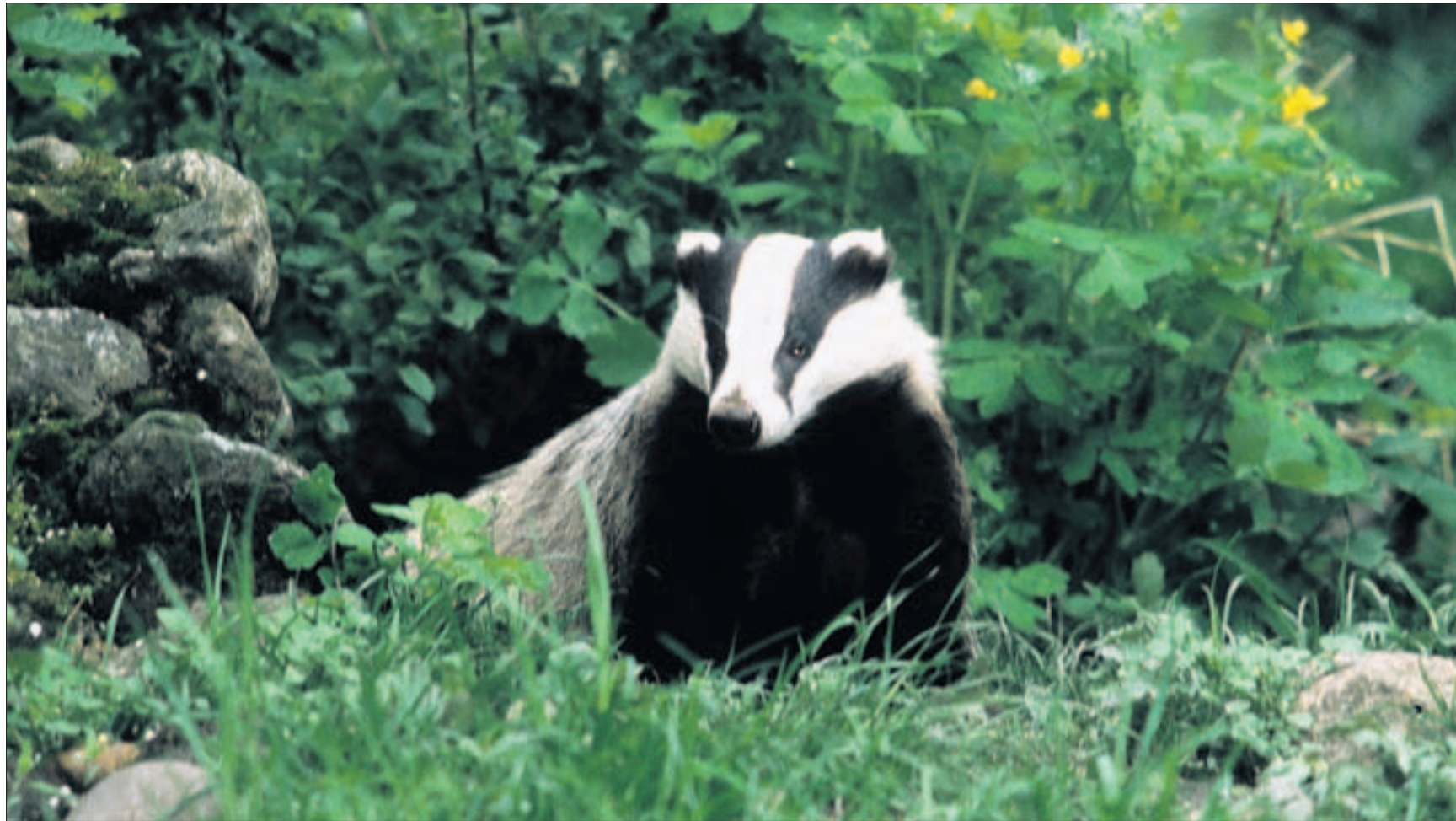
Nur wer stillhält und schweigt, hat die Chance, einen Dachse in freier Wildbahn anzutreffen.

Niederweningen In der Dämmerung verlassen die Dachse ihre Burgen