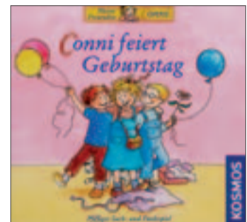
Conni feiert Geburtstag / Autor: Heinz Meister / Anzahl Spieler: 2 bis 4 / Spieldauer: etwa 15 Minuten / Alter: ab 5 Jahren / Verlag: Kosmos

Das Spiel endet, wenn alle sechs Krümelteller verteilt sind. Es gewinnt, wer sich keine oder die wenigsten Krümelteller eingehandelt und damit auch die meisten Gäste am Connis Geburtstagskuchen untergebracht hat. Annemarie Chiabotti